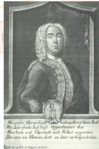
जोसेफ ओपनहायमर याचे चित्र